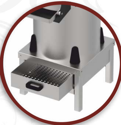
Filtre | Filter