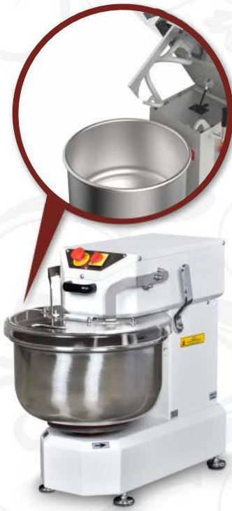
BSH.20 Kalkar Kafa