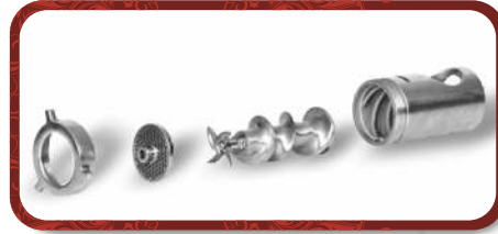
Removable Head Unit